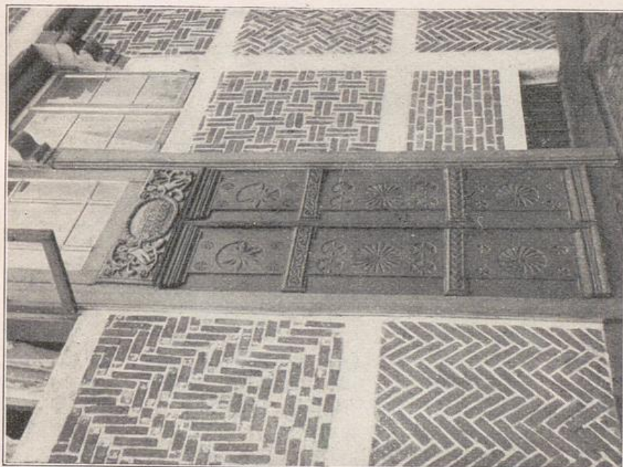
16. Altländer Haustür und Siegelmosaik, Österrort (Unterelbe).