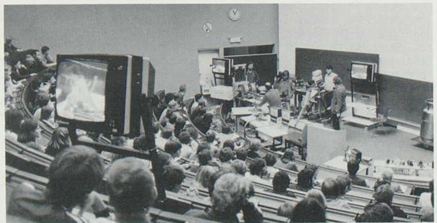
Die Paderborner Physiker riefen und ca. 1.500 Schüler kamen. Die Informationswoche wurde zu einem weithin beachteten Erfolg.