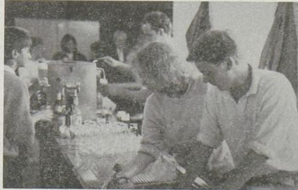
Alle Hände voll zu tun: Mitglieder des Festausschusses hinter'm Tresen.