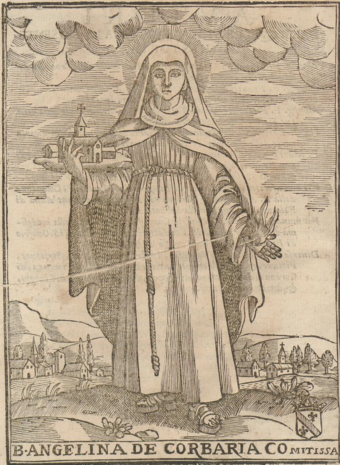
B-ANGELINA DE CORBARIA COMITISSA