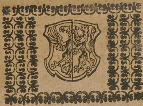
Insignia B. Richezzæ