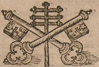
Papa Innocentius Agnaninus moritur.