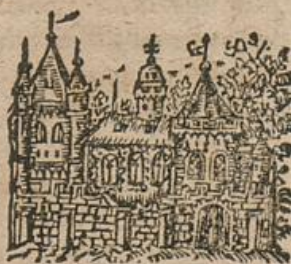
Monaste- rium Cam- pense.