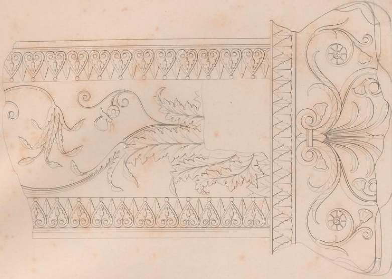
Stammwerk eines deutschen Vasenfußes von einem Sammler zu Leipzig.