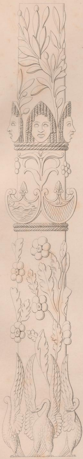
Fragment eines Candelabers von weißem Marmor, ausgegraben in der Casa di Apollo zu Pompeji 1839