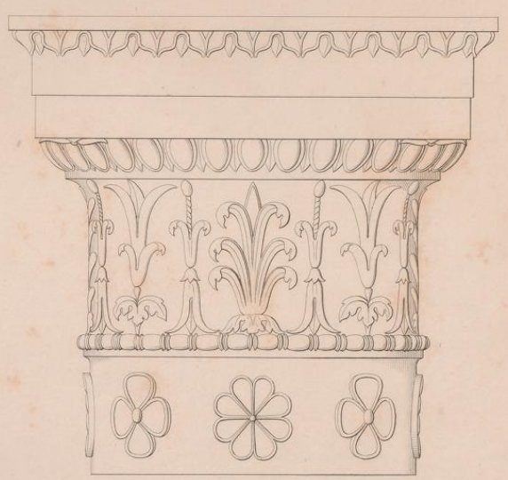
Antikes Capital von weißem Marmor, im Königl. Museum zu Neapel.