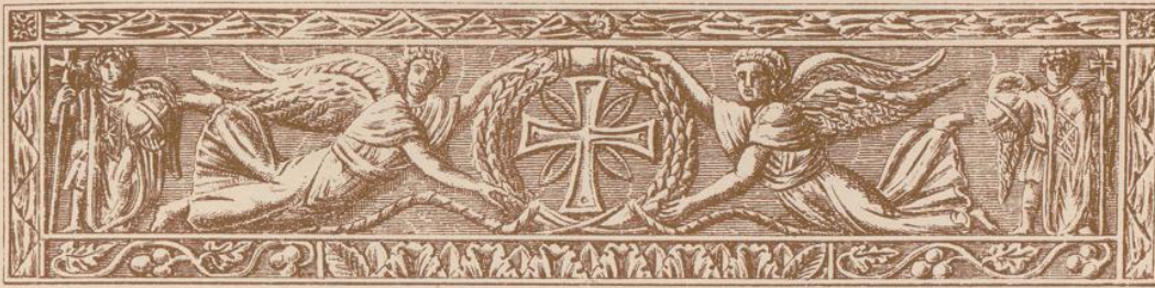
Kanzel. Frieze. — Byzantinischer Styl.