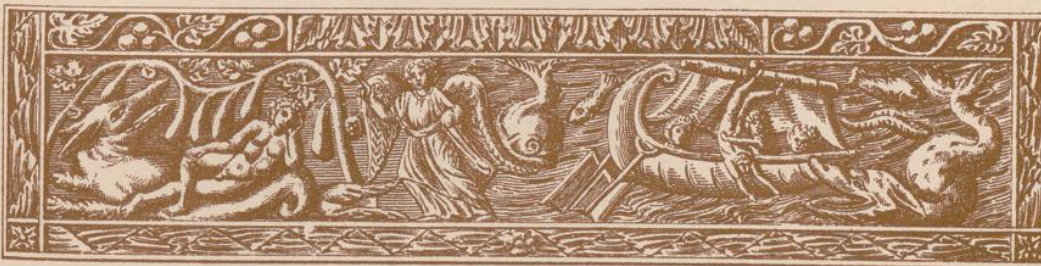
(Histoire du prophète Jonas).