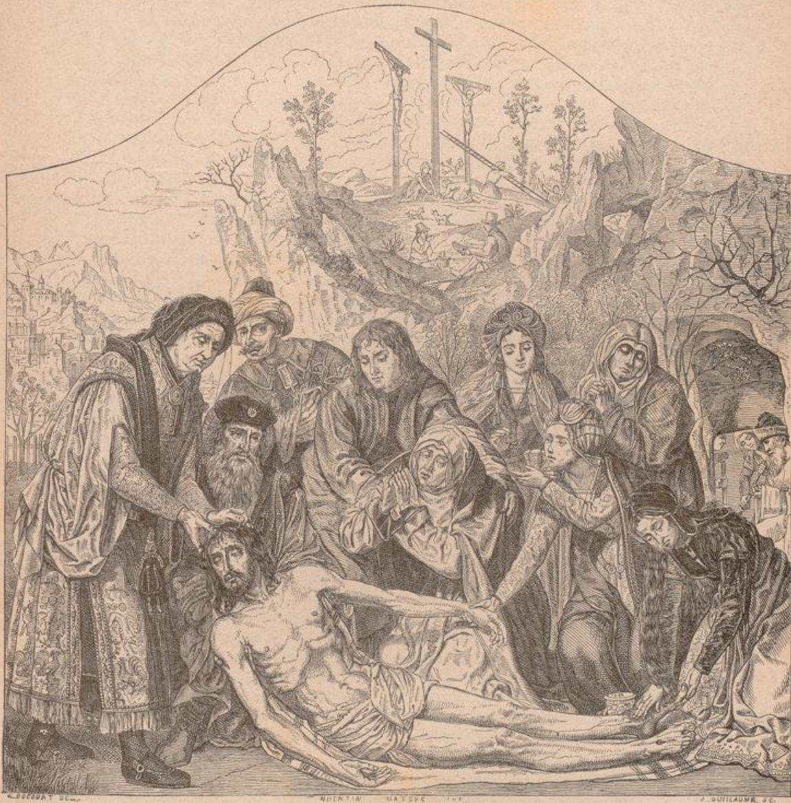
Die Beweinung Christi von Q. Massijs im Mufeum zu Antwerpen.