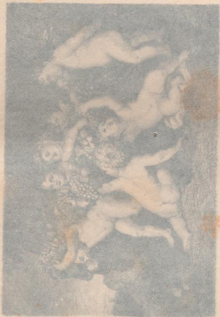
P. P. RUBENS, DER FRUCHTEKRANZ. Frankfurt an der Oder.