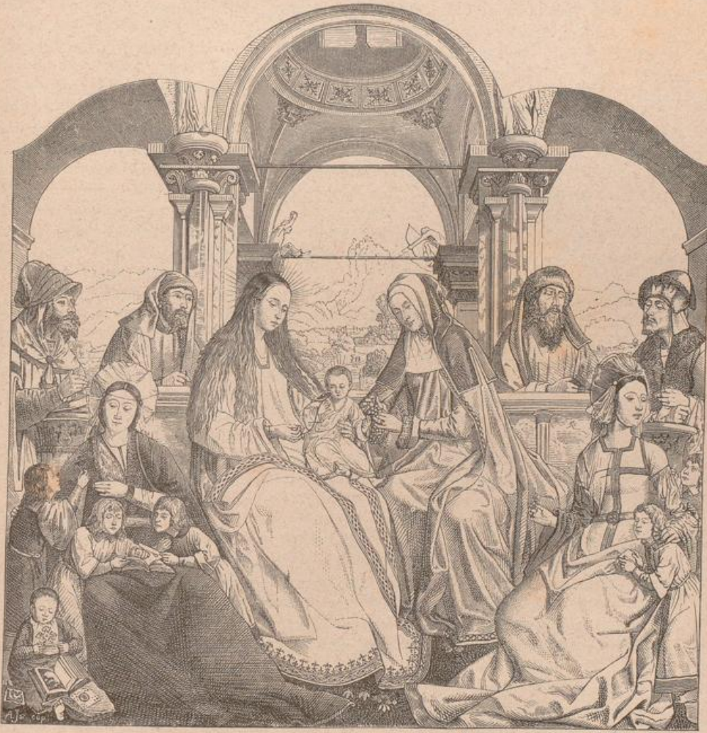
Die Legende der hl. Anna von Q. Massijs, Mittelbild des Triptychons aus St. Peter in Löwen (jetzt im Museum zu Brüssel).