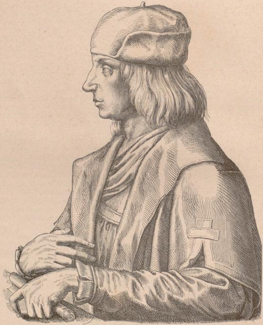
Porträt des QUINTEN MASSIJS. — Nach einem Stich von JAN WIERICX.