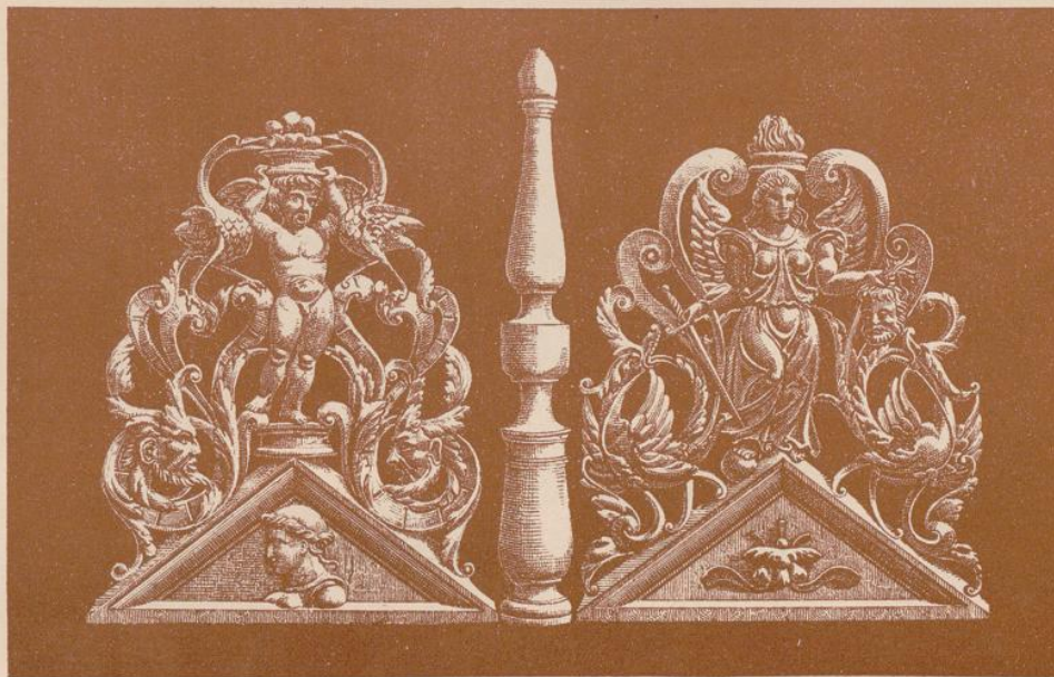
Couronnements de confessionnal.