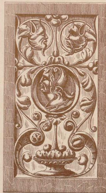
Füllungen in Holzschnitzkunst. — Renaissance-Styl.