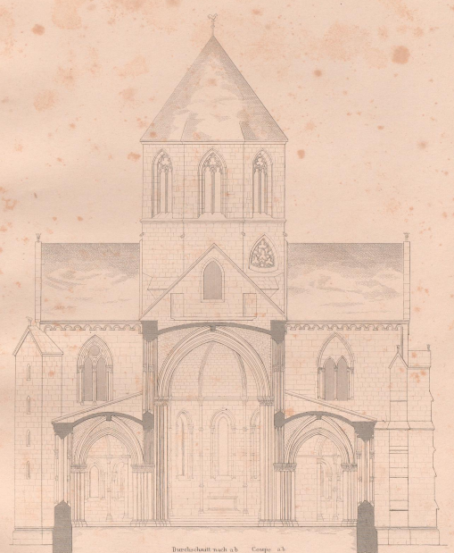
Durchschnitt nach ab Coupe ab