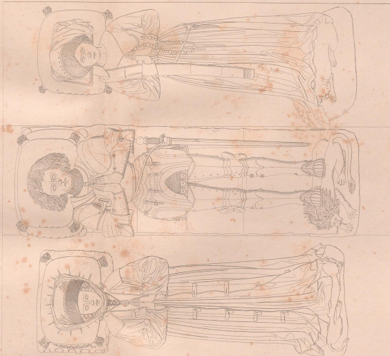
Die vier Evangelisten

Die vier Evangelisten sind dargestellt durch die vier Evangelien. Der Evangelist Matthäus ist durch einen Menschen, der Evangelist Markus durch einen Stier, der Evangelist Lukas durch einen Engel und der Evangelist Johannes durch einen Adler dargestellt. Die vier Evangelien sind durch die vier Evangelisten dargestellt.