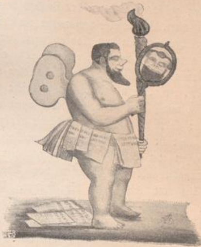
Ein Genius der Wahrheit. Karikatur auf Robert Blum aus dem Jahre 1848.