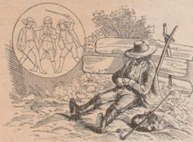
Schönster Traum eines Thüringischen Bauers.

Seine Anschauung prägte sich in denkwürdiger und drastischer Weise aus, als er die städtischen Behörden von Hannover am 6. März auf ihre sehr ehrerbietigen und bescheidenen Bitten um Pressfreiheit, ein deutsches Parlament und schleunigste Einberufung der Stände beschied. Denn diese Antwort war ganz im Ton einer Belehrung an unmündige und nicht ganz wohlzogene Schulknaben gehalten. „Meine Herren“, begann er, „Sie mögen es sich selbst nicht völlig klar gemacht haben, auf welche Weise Ihr Wunsch einer Volksvertretung bei dem deutschen Bunde, welcher ein Fürstenbund ist, zu verwirklichen sein könnte. Ihre Bemerkung selbst, daß die Erfolge der bisherigen Bundesthätigkeit nicht in allem Maße den zum Nationalgefühl erwachten Deutschen entsprochen“ — wir geben das