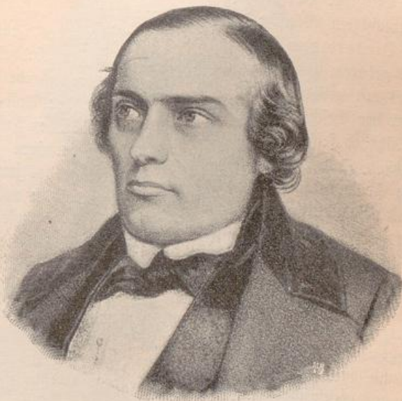
von Wydenbrugk. Lithographie von F. Hickmann nach Biows Lichtbild. 1848. Deutsche Nationalgalerie.

Den gleichen glatten und befriedigenden Verlauf nahm die Märzbewegung in den übrigen Kleinstaaten Norddeutschlands, wie Waldeck, Lippe u. s. w., und Mitteldeutschlands, wie Anhalt, Thüringen. In Weimar strömten große Haufen von Bauern in die Residenz — wie gleichzeitig auch in Gotha und zu anderen thüringischen Fürstenthümern — und trugen den wackeren Verteidiger ihrer Rechte, den Weimarer Advokaten v. Wydenbrugk auf ihren kräftigen Schultern vor die Fenster des Großherzogs, mit dem treuherzigen Verlangen, der Landes-