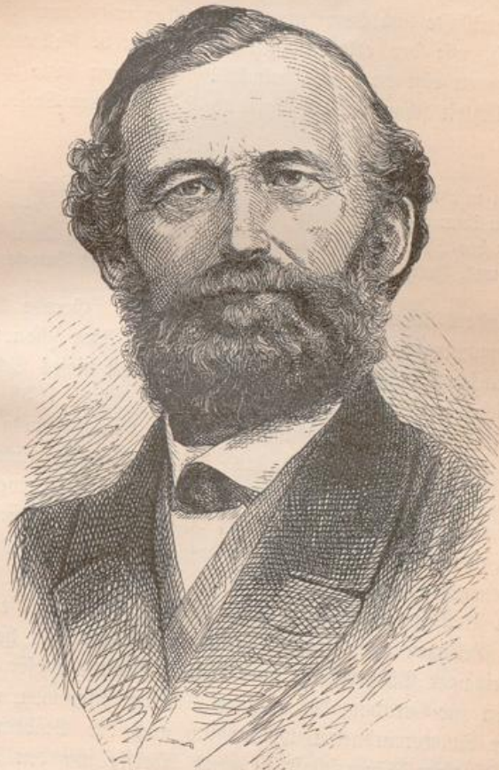
Professor Biedermann, Vizepräsident der deutschen Nationalversammlung.

Handlungen entschlossen waren, durch die überzeugende Kraft seines ungeheuren Ranges beherrschenden mächtigen Wortes zur Bahn der Ordnung und des Gesetzes zurückführen, und dadurch unabsehbar verhängnisvolle Folgen verhüten. Von dieser Gottesgabe hatte er in den furchtbaren Leipziger Augusttagen 1845, da durch eine ganz unnötige Salve des Militärs zwölf schuldlose Leipziger Bürger blutig hingestreckt wurden, den berechtigten Unmut seiner Mitbürger in den Bahnen gesetz-