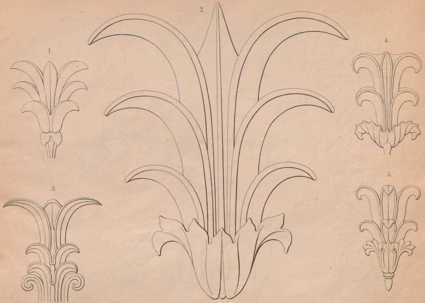
Fig. 1. fünfmal und Fig. 2. einhalbmal grösser, dann Fig. 3. und 4. dreimal grösser und Fig. 5. fünfmal grösser aufzuzeichnen.