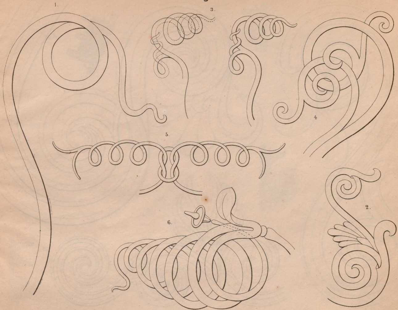
Fig. 1. u. 2. in doppelter Gröfse auf ein Blatt zu zeichnen; Fig. 3. in fünffacher u. Fig. 4. in vierfacher Gröfse, dann Fig. 5. u. 6. in dreifacher Gröfse jedesmal auf ein Blatt zu zeichnen.