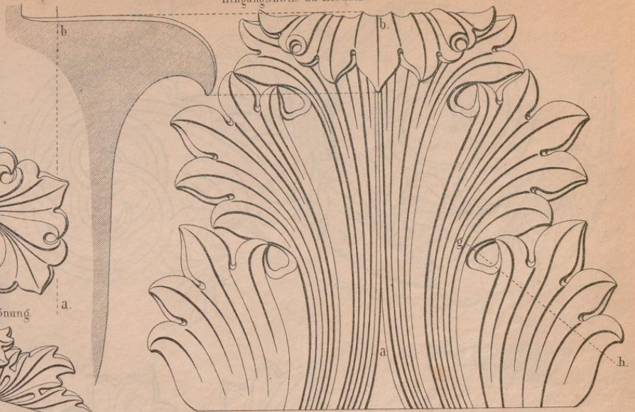
Fig. 4. Von einem korinthischen Kelchkapital aus Pästum.