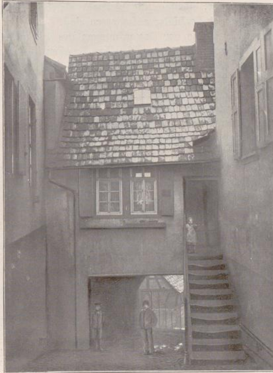
Abb. 247. Höllensstaffel, Weinheim.

wird folgendes Urteil gefällt: „Ob aber einer kan ueber seinen Brucken / Tuecher / Leylacher / oder was anders hinaus haengen / dadurch er seinem Nachbahr das Licht benimmt / so ist es auf diese Art und Weise zu unterscheiden: Erstlich / wenn ers allein auf den Seinigen will auslegen / und nicht hinaus strecket; Als zum Exempel / wann ers in die Höhe aufbreiten wolte / wie gemeiniglich die jenigen thun / die auf ihren Daechern / Druck-Staedten oder Buehnen Bruecken haben / denn es kan ein jedweder auf seinen Erdboden / so weit sich derselbe erstreckt / bauen / legen und thun / was