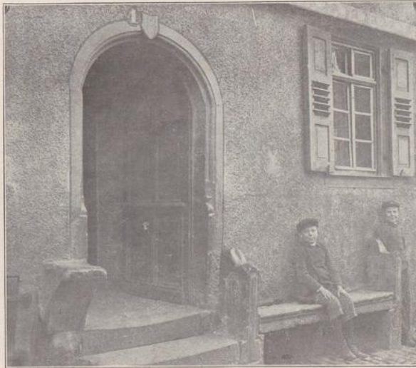
Abb. 243. Gerbergasse 4, Bensheim.

War man so bestrebt, die Ausschütze zu beseitigen, die dem Straßenverkehr hinderlich waren, so ging man gegen die im ersten Obergeschoß beginnenden Erker oder Chörlein etwas milder vor. Dieselben sind namentlich in der Renaissancezeit allgemein üblich und beliebt, und gibt uns die Apotheke zu Heppenheim (Tafel 18) ein prachtvolles Beispiel einer derartigen Anlage. In hiesiger Gegend (Bergstraße) wurde als Norm angenommen „dass im andern stock (erstes Obergeschoss) vnd von dannen durch