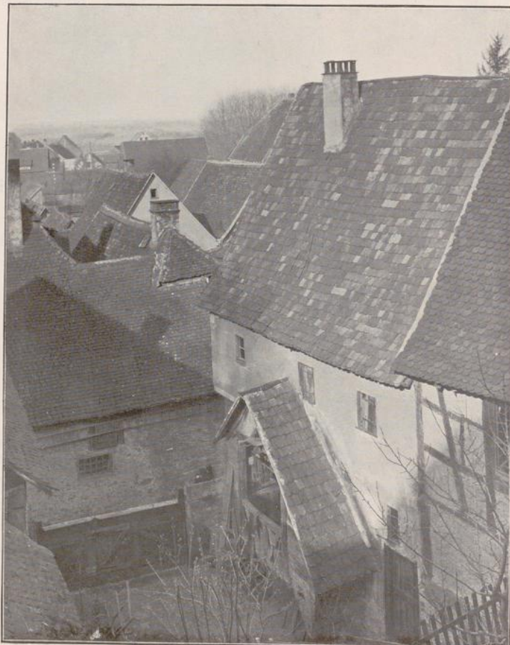
Abb. 241 a. Häusergruppe aus Zwingenberg.

Von größerer Wichtigkeit für unsere Abhandlung sind die aus dem 16. und 17. Jahrhundert stammenden Anordnungen hinsichtlich der Erkerbauten, und gibt