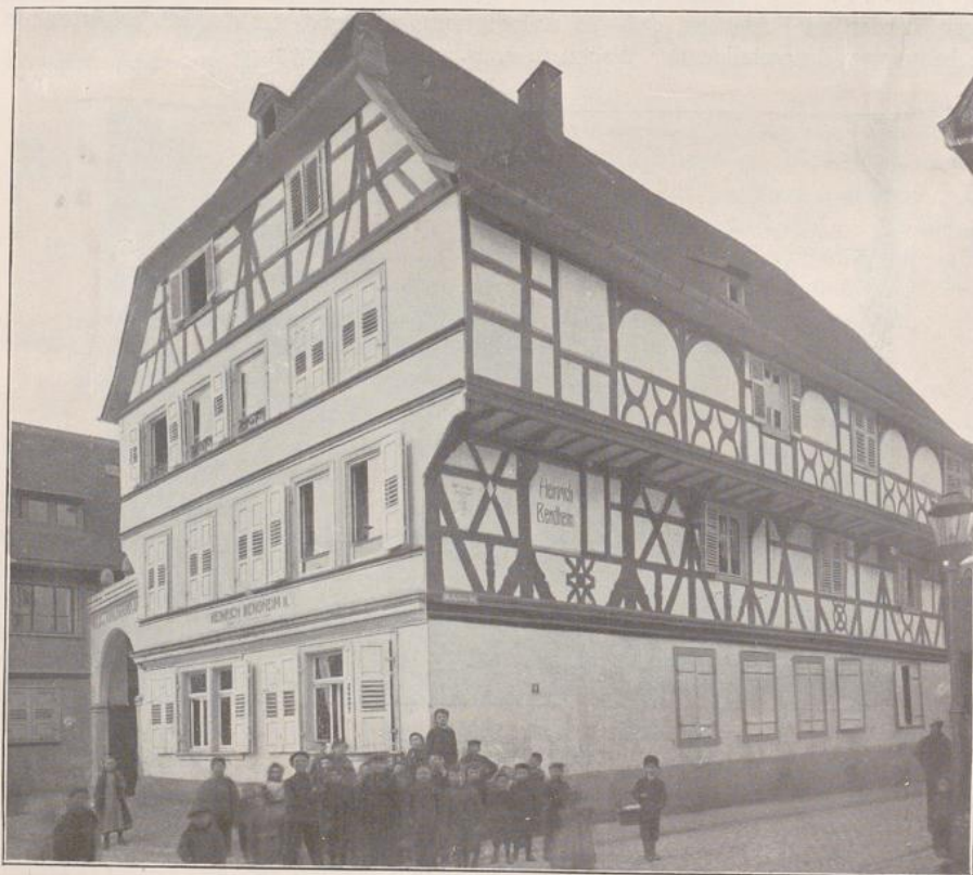
Abb. 246. Bendorfsches Haus, Bensheim.

Ein mit Recht in den Bauordnungen des 16. Jahrhunderts angegriffener Unfug ist die vielfach geübte Sitte, einzelne Häuser durch Holzbrücken oder geschlossene Gänge