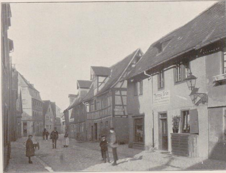
Abb. 245. Neugasse, Bensheim.

keinen besonders angenehmen Eindruck hervorgerufen haben, da des Tags über die Krämer sicher ihr Wesen in denselben trieben und mit ihrer oft recht unsauberen Beschäftigung die künstlerische Wirkung wesentlich beeinträchtigten. Auch vom praktischen Standpunkte kann die Anlage nicht gut geheißen werden, denn die anschließenden Läden waren infolge der geringen Laubenhöhe ziemlich dunkel und die darüber befindlichen Räume vollkommen fußkalt. Eine wenn auch etwas urwüchsige Anordnung zeigt Tafel 16 in dem Hause Schulgäßchen 24 zu Heppenheim. Doch darf nicht unterlassen werden zu bemerken, daß die Anlage voraussichtlich nur deshalb erfolgte, um ein bequemes Unterstellen der Wagen u. s. w. zu ermöglichen.