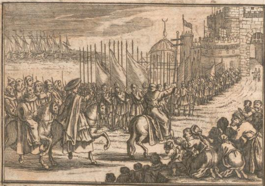
Ingressus Ximenii Cardinalis in captam a se Maurorum Urbem.