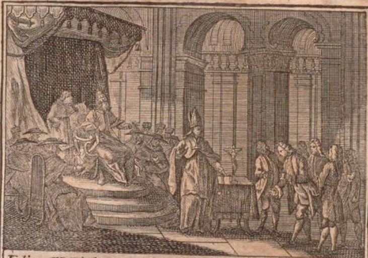
Julius III. Diploma pro convocanda Synodo promulgat.