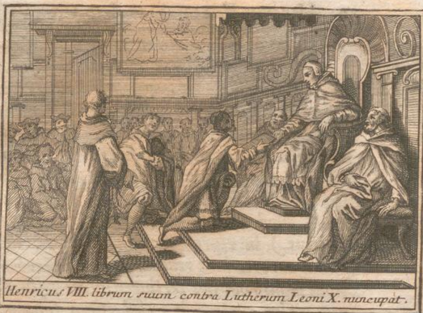
Henricus VIII. librum suum contra Lutherum Leoni X. nuncupat.