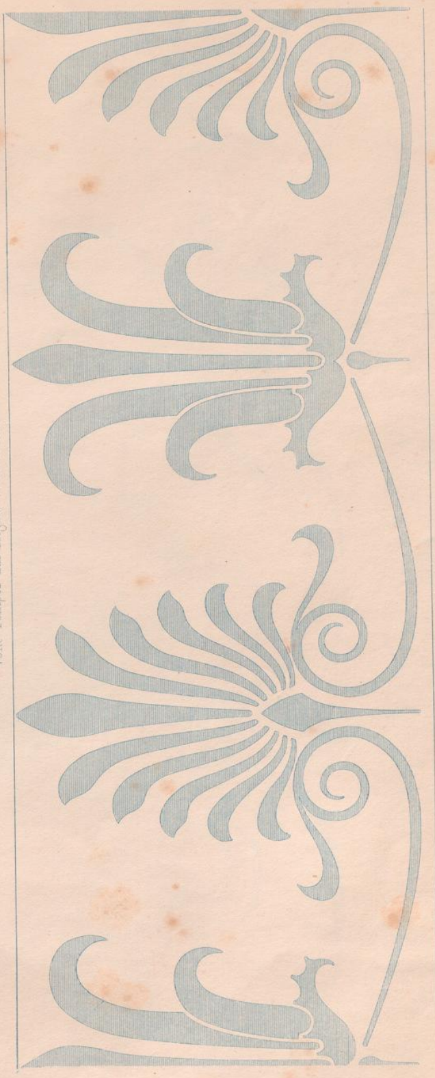
Vom Tempel der Nemesis zu Rhamnus ganze Größe.