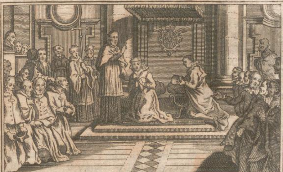
Anglia Sedi Apost: reconciliata regnante Maria.