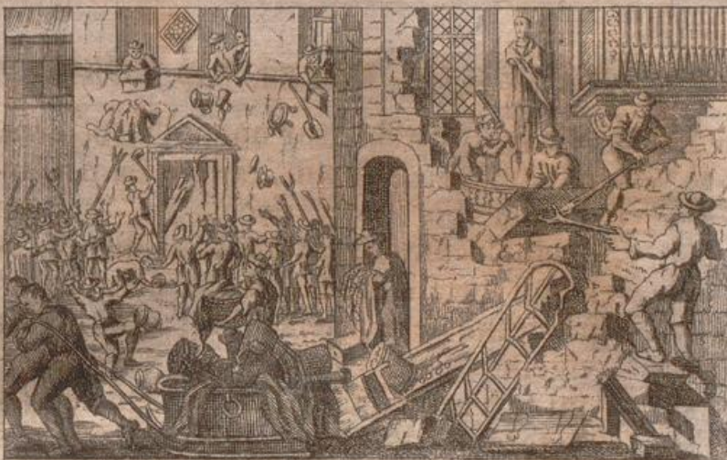
Cæsarei Legati Sacellum et Palatium ab Ham- burgensibus Lutheranis funditus everſa.