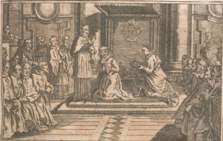
Christina Sueciæ Regina Ecclesiæ Catholicæ reconciliata. 49.