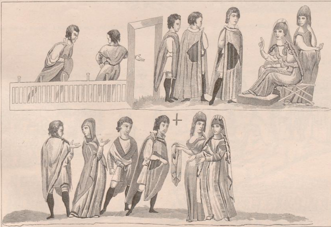
3. Potiphars Frau verklagt Joseph. Miniatur aus der griechischen Handschrift der Genesis in der Wiener Hofbibliothek.