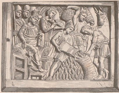
2. Kornverkauf. Relief von der Kathedra des Maximian in Ravenna.