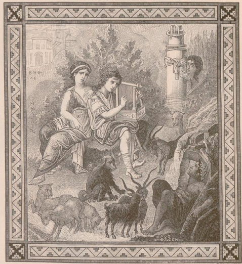
4. David als Hirt. Miniatur, aus einem griechischen Psalter. Paris, Nationalbibliothek.