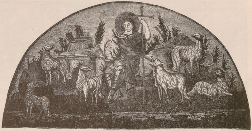
2. Der gute Hirt. Mosaik aus der Grabkapelle der Galla Placidia zu Ravenna.