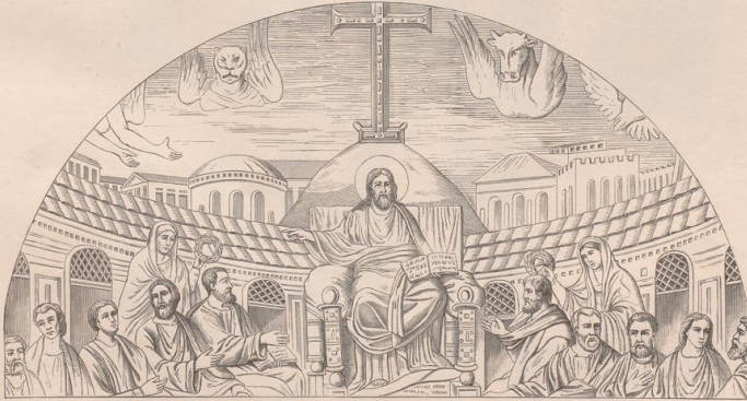
3. Mosaik aus S. Pudenziana in Rom.