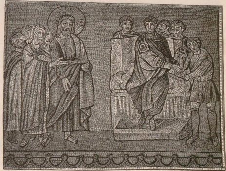
4. Christus vor Pilatus. Mosaik aus S. Apollinare nuovo in Ravenna.