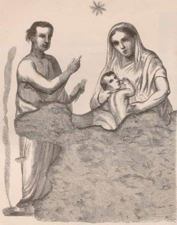
1. Wandmalerei aus den Katakomben der Priscilla an der via Salara bei Rom.