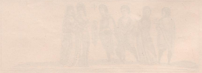
Faint caption text below the bottom-left engraving.