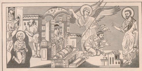
5. David u. Jeremias. Miniaturmalerei aus dem Gregor von Nazianz. Paris, Nationalbibliothek.