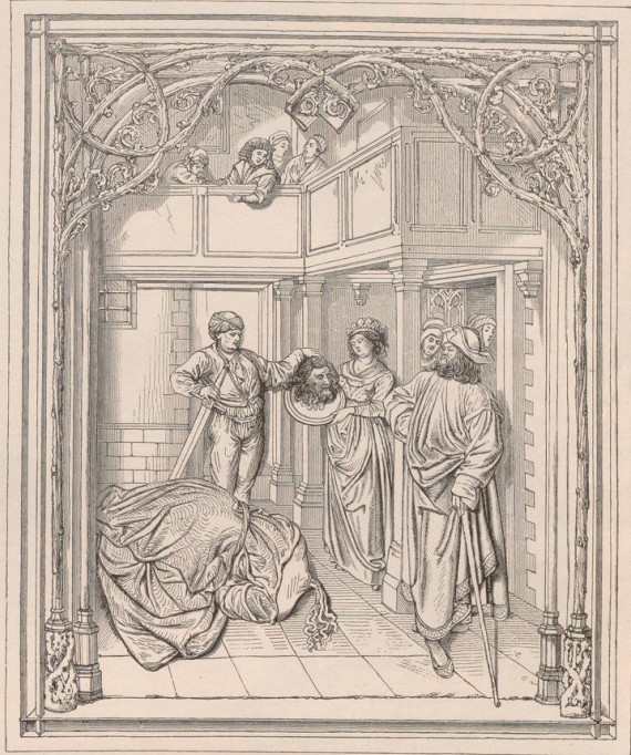
Reliefs vom Johannistempel in Krakau, von Veit Stoss. (M. d. K. K. Centr. Comm. 1881.)