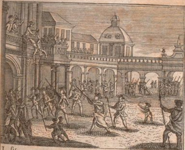
Lusitanorum defectio ab Hispanis.