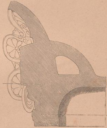
Ansicht, Grundriss und Durchschnitt eines Stirnziegels aus gebranntem Thon in dem Museum zu Perugia. Etruskisch.