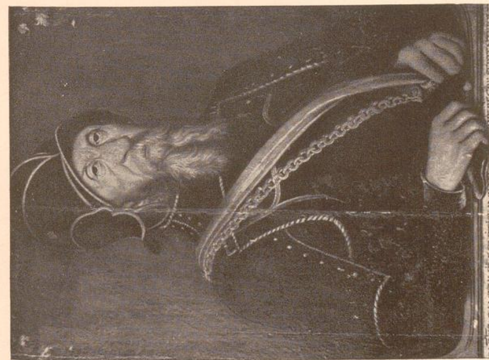
Johann Kanzau, der Unterwerfer Dithmarschens Gemälde im Schloß Breitenburg.