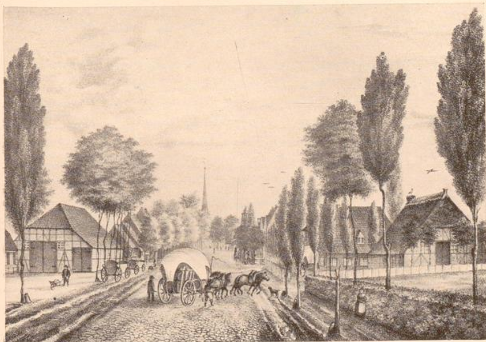
Wandsbeck um 1840 Lith. von J. C. C. Meyer