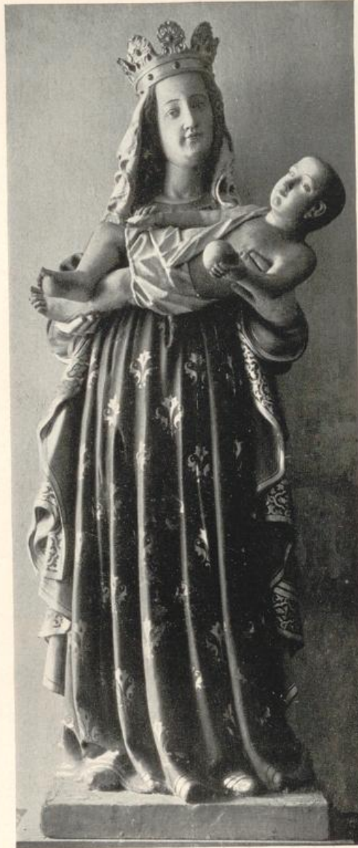
Abb. 72. Gervasiuskirche. Stehende Muttergottes.

Dachreiter mit Schallöffnungen auf allen Seiten, geschweiften Haube, achtseitiger offener Laterne und Spitzhelm (1894) als Ersatz des Holztürmchens der Minoriten. Das sechsjochige Kirchenschiff mit dreiseitigem Chorausschluss ist im Innern weitgehend restauriert. Wenig vortretende, breite Pilaster, an deren verkröpftem Gebälk sich in Kartuschen Vogelmedaillons befinden, gliedern die Seitenwände. Die Decke des Kirchenschiffes, laut Gutachten des Baumeisters Spieker von 1861 ein Holzgewölbe, d. h. eine Konstruktion, die mittels Holzrippen, Deckenschalung und Putz die Form eines wirklichen Steinkreuzgewölbes nachahmt, wurde 1861 in einzelnen Teilen erneuert.