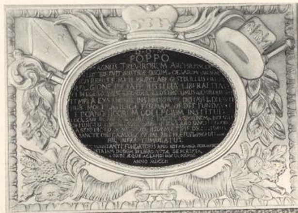
Abb. 75. Gervasiuskirche. Gedenkplatte für Erzbischof Poppo.