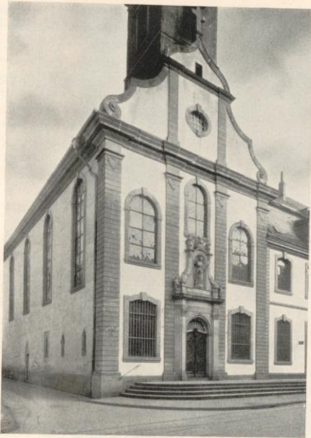
Abb. 69. Gervasiuskirche. Ansicht von Nordwesten.