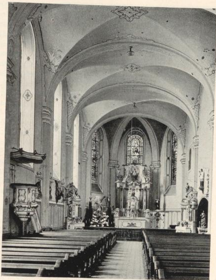
Abb. 71. Gervasiuskirche. Innenansicht. Hauptschiff nach Osten.

Der neue — bis 1803 einschiffige — Bau ist auf den Fundamenten des alten errichtet. „Die alte Kirche ging in ihrer Länge nicht über die vier ersten Fenster der jetzigen hinaus, war auch am unteren Ende 12 Fuß schmaler und dunkel. Sie hatte eine Holzdecke“ (LAGER-MÜLLER). Vier gotische Fensterumrahmungen (mit Dreipaßteilung), die 1927 an der Nordseite unter dem Verputz freigelegt wurden, und ein Absatz im Verputz in Höhe der jetzigen Fensterbauten lassen noch deutlich den früheren Nonnenchor mit seinen kleinen Fenstern erkennen. Diese kleinen gotischen Fenster führten zu dem Raum unter der Schwesternempore. Von den Fenstern über der