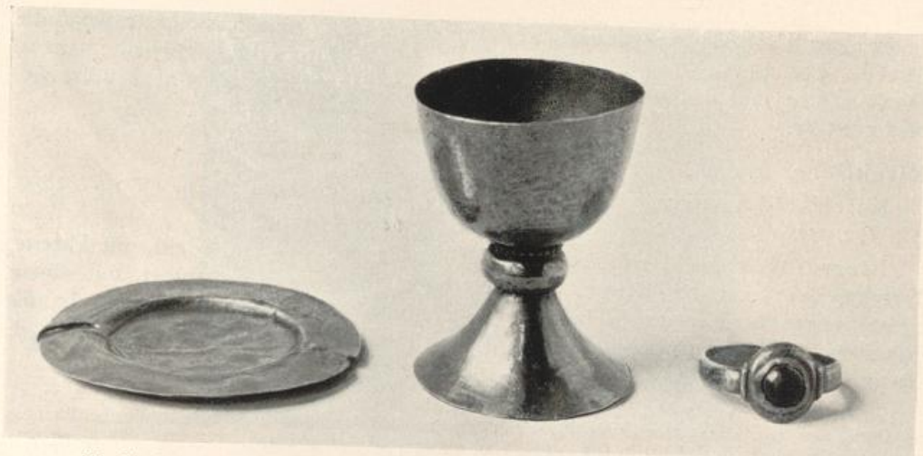
Abb. 74. Gervasiuskirche, Pfarrhaus. Kelch, Patene und Ring aus dem Grab Erzbischof Poppo.

Relief, Anbetung der Weisen, Stein, aus der Porta Nigra. — Relief, hl. Michael, Stein, aus der Porta Nigra. Beide H. 1,57 m, Br. 1,18 m, anscheinend Altaraufsätze des ausgehenden 18. Jh.