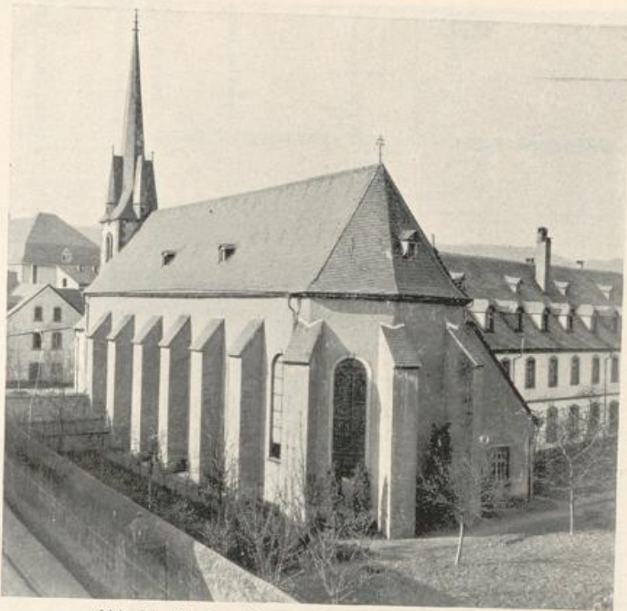
Abb. 97. Klarissenklosterkirche Ansicht von Südosten.