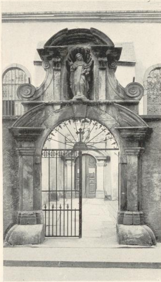
Abb. 100. Klarissenklosterkirche. Hofportal.

Im obersten Geschoß befindet sich je eine rundbogige, zweiteilige Schallöffnung mit schlichtem Maßwerk. Das sehr schlanke Dach hat erkerartige Ausbauten nach jeder Turmseite.