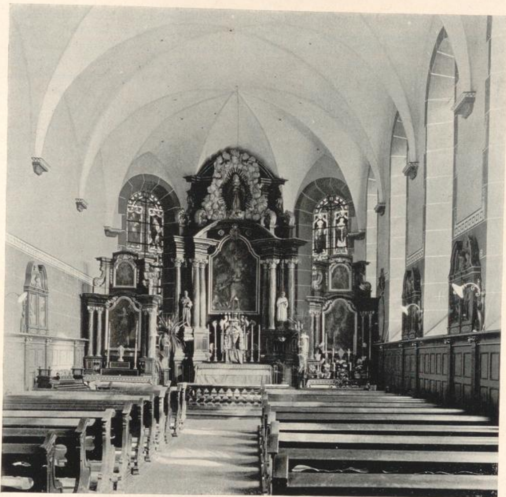
Abb. 99. Klarissenklosterkirche. Innenansicht nach Osten.