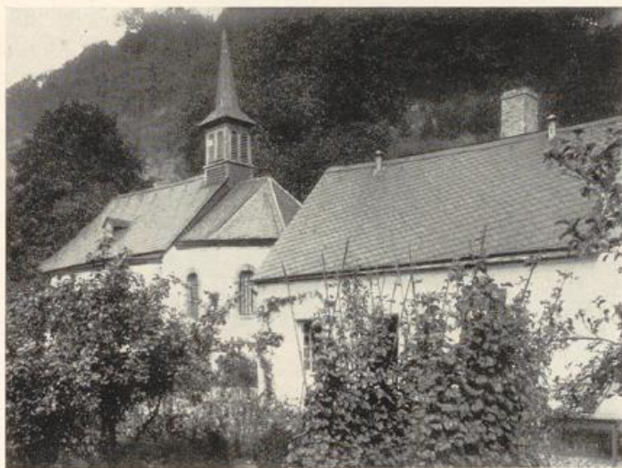
Abb. 278 a. St. Jost, Ehemaliges Leprosenhaus mit der Jakobskapelle.