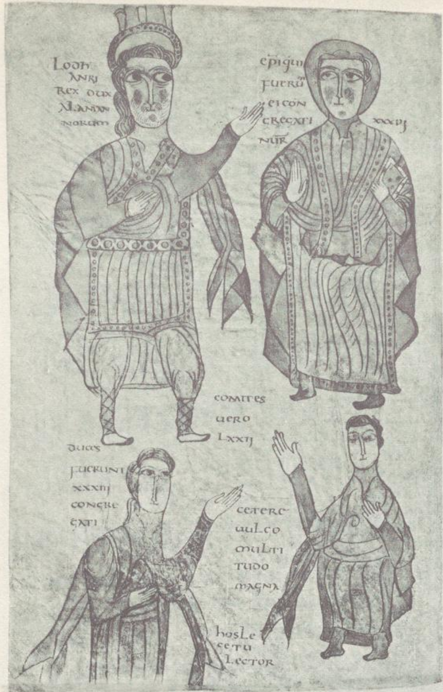
Aus der Handschrift Paris. Nationalbibliothek. Lat. 4404. fol. 197'.