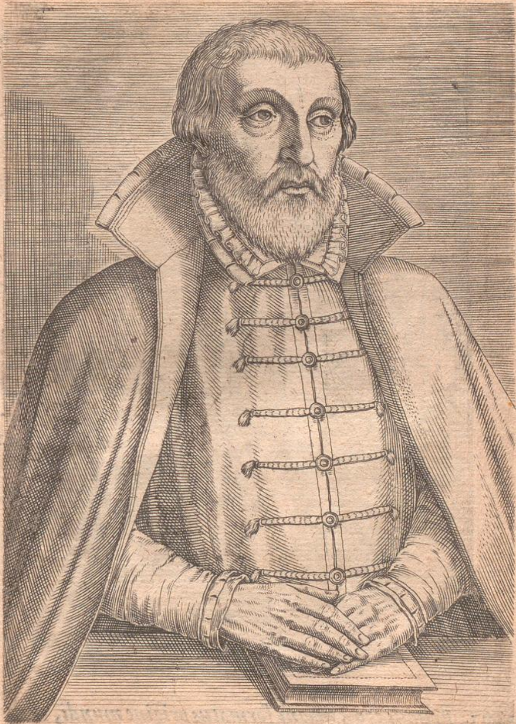
A 2 ADAM.