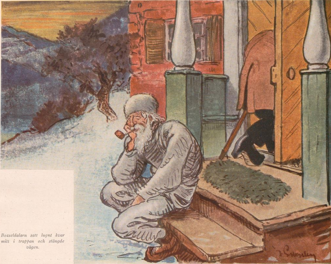
Bossdalar'n satt lugnt kvar mitt i trappan och stängde vägen.

göra. Du vandrar inte din väg ostraffligen, Oscar. Du låter ditt pund ligga nedgrävt.»