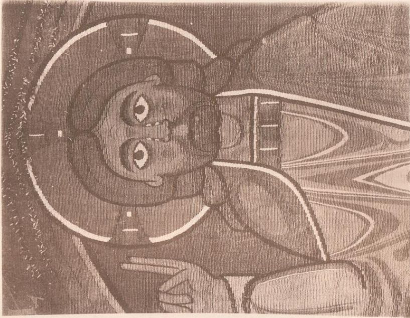
Apostelteppich (Ausschnitt) Halberstadt, Dom