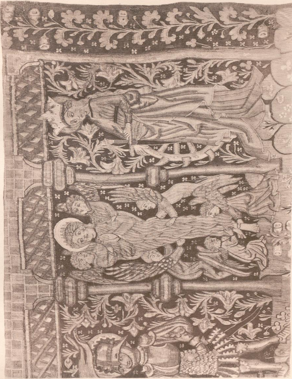
Teppich mit Madonna und Heiligen (Ausschnitt) Thun, Historisches Museum