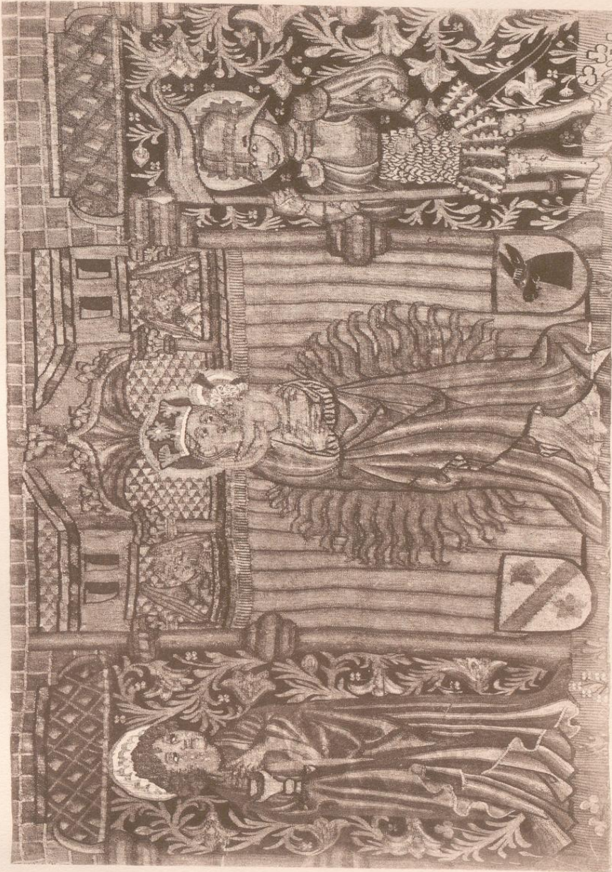
Teppich mit Madonna und Heiligen (Ausschnitt) Thun, Historisches Museum