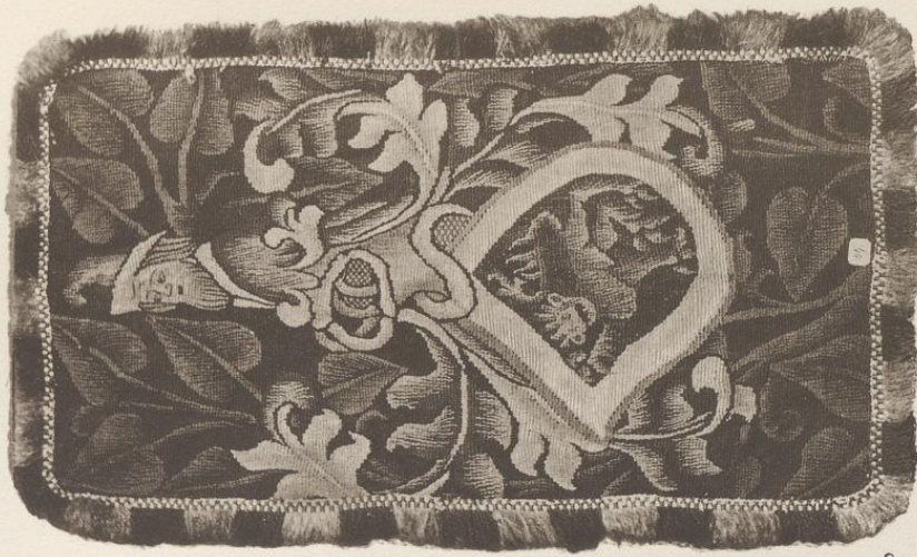
b) Kleiner Teppich mit Wappen München, Bayerisches Nationalmuseum