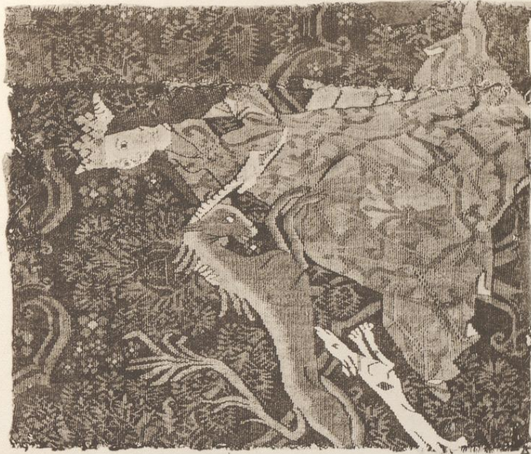
Fragment mit Jungfrau und Einhorn München, Bayerisches Nationalmuseum