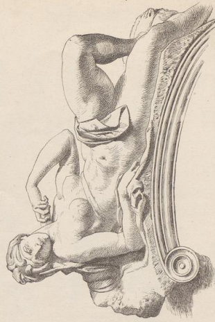
3. Der Morgen. Vom Grabmal des Lorenzo de' Medici. S. Lorenzo in Florenz.