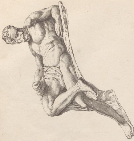
2. Der Abend. Vom Grabmal des Lorenzo de' Medici. S. Lorenzo in Florenz.