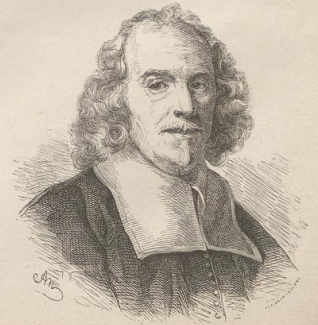
5. Lorenzo Bernini. (1598—1680.)

Druck von Metzger & Wittig in Leipzig. — 2. Abdruck 1880.