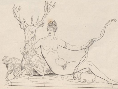
6. Diana, von Jean Goujon. († 1572.) Louvre.

Druck von Metzger & Wittig in Leipzig. — 2. Abdruck 1880.