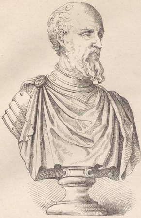
1. Tommaso Contarini, Marmorbüste von Alefiandro Vittoria. (1525—1608.) S. Maria dell' Orto in Venedig.