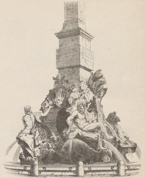
3. Brunnen auf Piazza Navona zu Rom. Von Lorenzo Bernini.