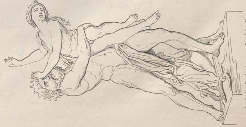
5. Raub der Proserpina, von Bernini. Rom.