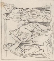
1. Relief von Albino Berruguete. (1480—1501). Toledo.