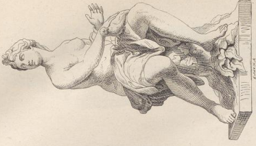
7. Die Fallengelatin. Von Nicolas Coustou. (1734—1735).