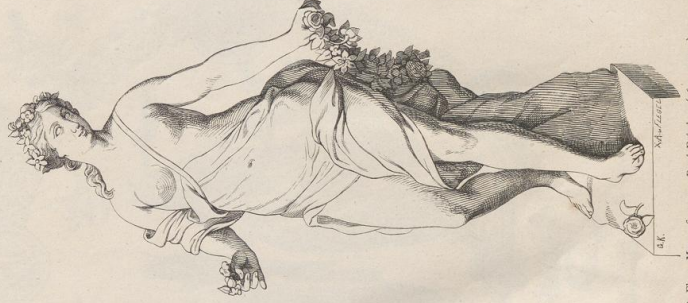
8. Flora, Marmorfigur von René Frémis. (1694—1744).