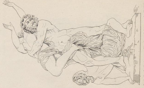
6. Raub der Proserpina, von Gianlorenzo Bernini. (1688—1715). Venedig.