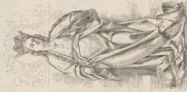
6. Von einem Altar aus Botem. National-Museum in München.