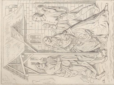
2. Vom Hochalter des Klosters zu Blaubeuren. Utenr. Schale, 1497.