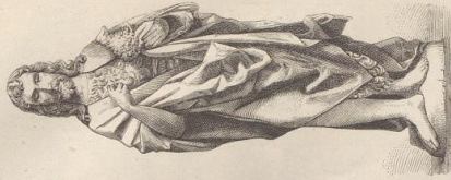
4. Johannes der Täufer, Beigebirn. Fränkische Schule.

Sammlerle auf aller Tafel dargestellten Gegenstände sind Hofschilderwerke auf Ausnahme von Figur 1.