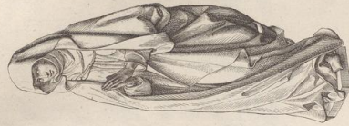
3. Madonna zu Blumentberg. National-Museum in München.