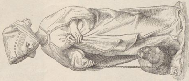
5. S. Margaretha. Museum zu Freiburg.