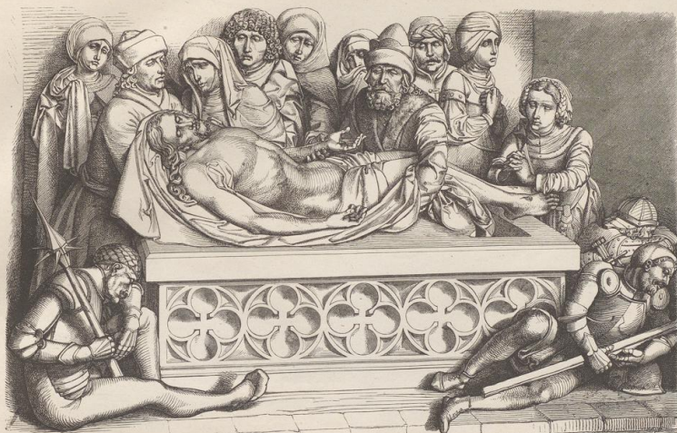
1. Die Grablegung Christi. Von Adam Krafft. Holzschuber'sche Grabkapelle auf dem Johannis-Kirchhofe zu Nürnberg. Sandstein.