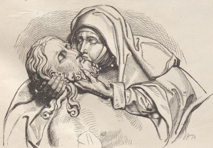
2. Pietà. Von Adam Krafft. Von der siebenten Station vor dem Thiergärtner Thor zu Nürnberg. Sandstein.