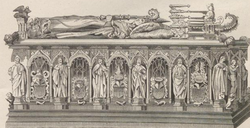
5. Grabmal des Erzbischofs Ernst im Dom zu Magdeburg. Von Peter Vischer. Erzgufs.