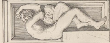
5. Manicule. Von Benvenuto Cellini. (1495—1566). Opera del Duomo in Florenz.