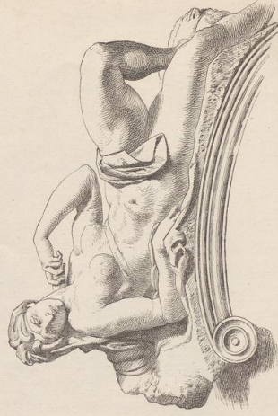
3. Der Morgen. Vom Grabmal des Lorenzo de' Medici. S. Lorenzo in Florenz.