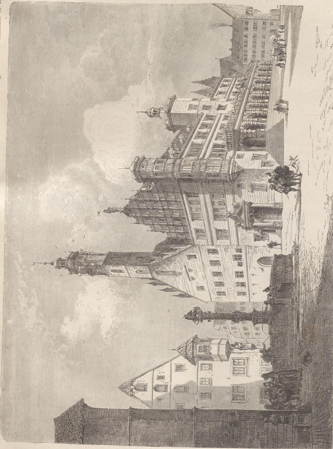
1. Marktplatz mit Rathhaus (erhant seit 1579) in Reichenburg a. d. Tauber.